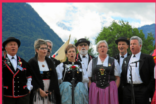
ZUM SINGEN UND JUTZEN