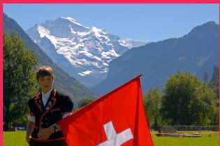
GROSSER TAG DER JUGEND